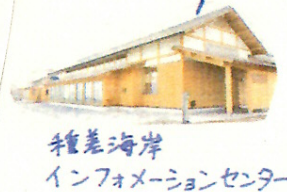
種差海岸インフォメーションセンター